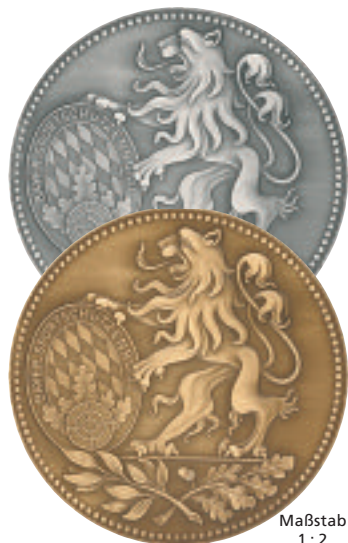
Maßstab 1 : 2