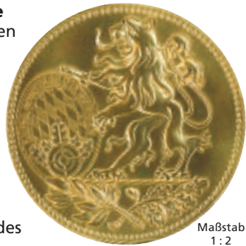
Maßstab 1 : 2

Anträge zur Verleihung sind zu Beginn des Jubiläumsjahres über den zuständigen Bezirk schriftlich in der Geschäftsstelle des BSSB einzureichen.